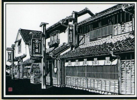
【鬼平江戸処その2】 三平 資郎 作